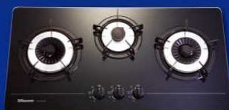
RG-320GB(T) 黑色 煤氣 RG-320GB 黑色 石油氣