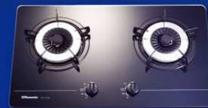
RG-213GB(T) 黑色 煤氣 RG-213GB 黑色 石油氣