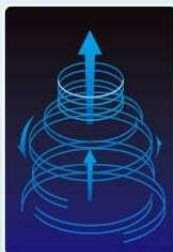
旋轉式火焰可有效提高燃燒效能

採用精密加工的斜紋條型火孔，以一致的內旋角度送出火力，形成強勁的向內旋轉上升火焰。其嶄新設計能有效地集中熱量，並同時把外圍助燃空氣引入，大大減低熱量四散，提高燃燒效能。