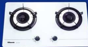
RG-213GW(T) 珍珠白 煤氣 RG-213GW 珍珠白 石油氣