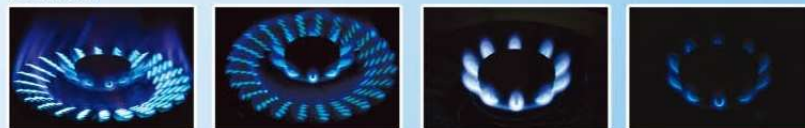
內外環火 — 全開

雙環爐頭備有四種火力調校模式，內外環均可隨意調校大小火力，同時仍能保持旋風式火焰的燃燒狀態。無論煎、炒、煮、炸、煲、燉的烹調方法，火力調校均從心所欲。