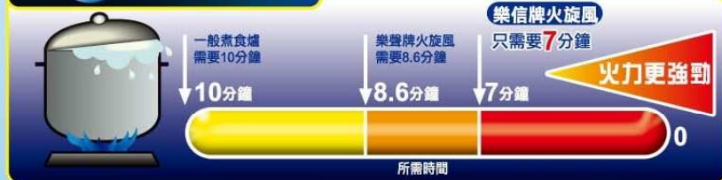
以煲水1公升作實驗，樂信牌「火旋風」需最短時間