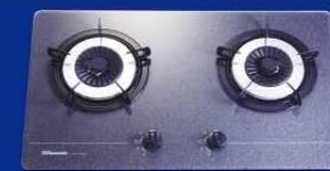
RG-213GM(T) 石紋 煤氣 RG-213GM 石紋 石油氣