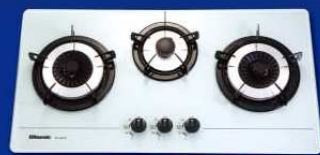
RG-320GW(T) 珍珠白 煤氣 RG-320GW 珍珠白 石油氣